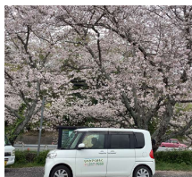
ドライブ♪ ※以前の写真