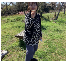
ちょっと一息 ※以前の写真