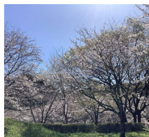
天気も良好 ※以前の写真